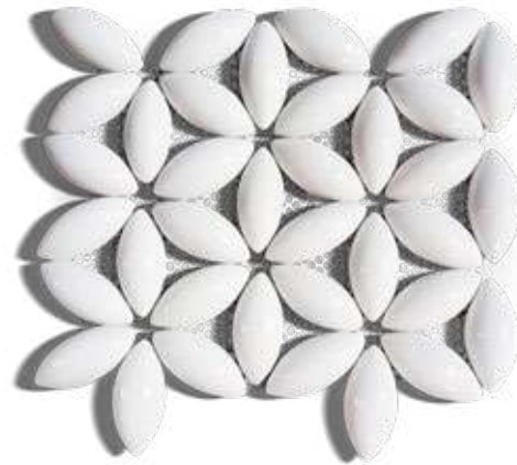
MOSAICO ROSETÓN BLANCO BRILLANTE