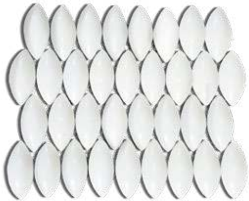
MOSAICO 3D BLANCO BRILLANTE